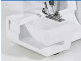
Wahlweise Nähen mit Freiarm oder Flachbett