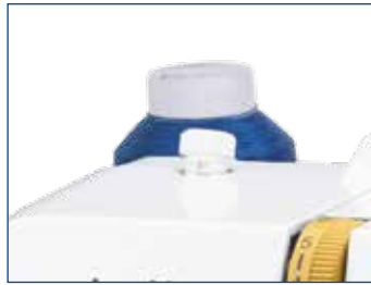
Nähfußdruck stufenlos einstellbar