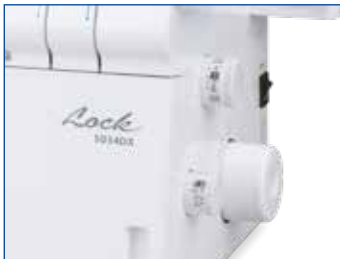
Einfache Stichweiten und -längen Regulierung über Drehrad